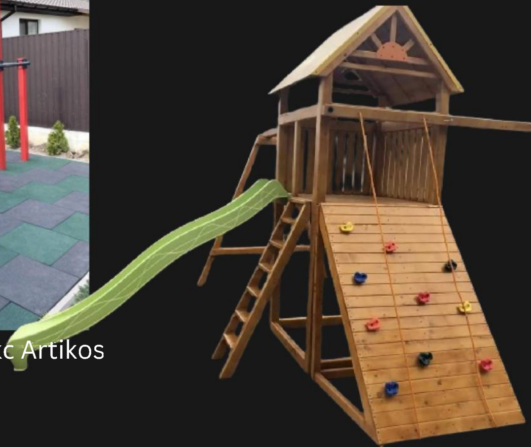
Комплекс дитячий спортивно-ігровий "Пірамідка"