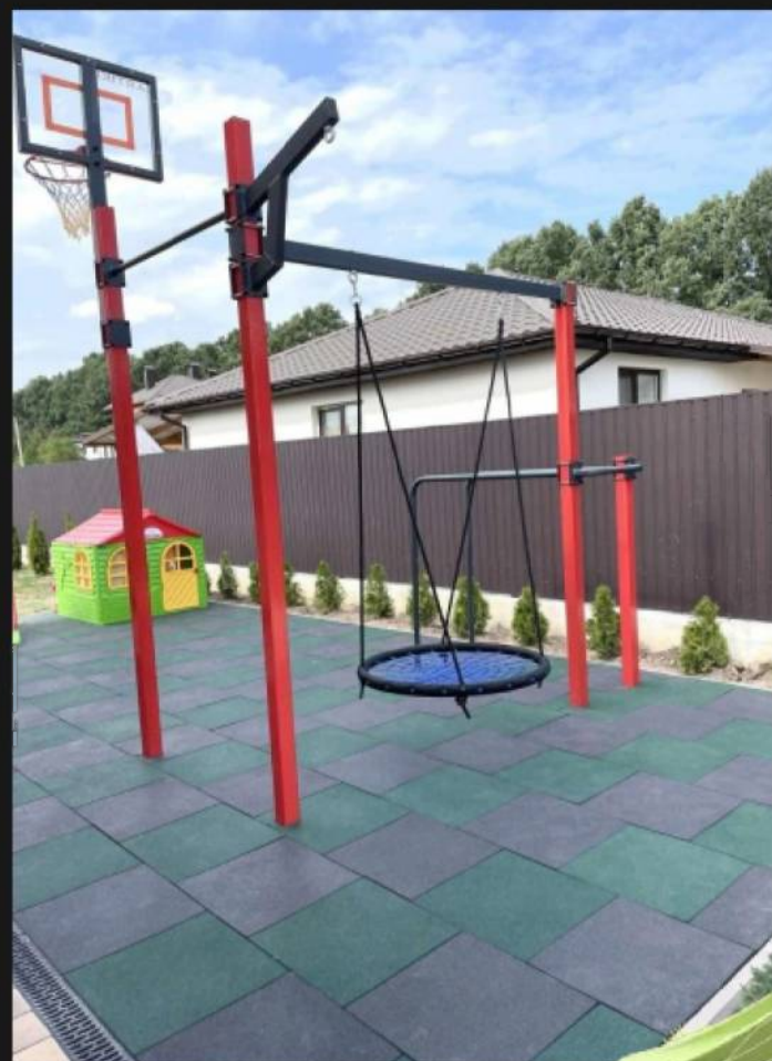
Спортивний комплекс Artikos

Комплекс спортивного майданчика (універсальний вуличний тренажер, орбітрек, тяга зверху-жим від грудей, жим ногами горизонтальний-маятник, гребний тренажер, тенісний стіл)