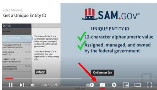
Integrated Award Environment (IAE) Get a Unique Entity ID in SAM.gov

Для відео є можливість увімкнути субтитри і в «Налаштуваннях» вибрати автоматичний переклад на українську мову.