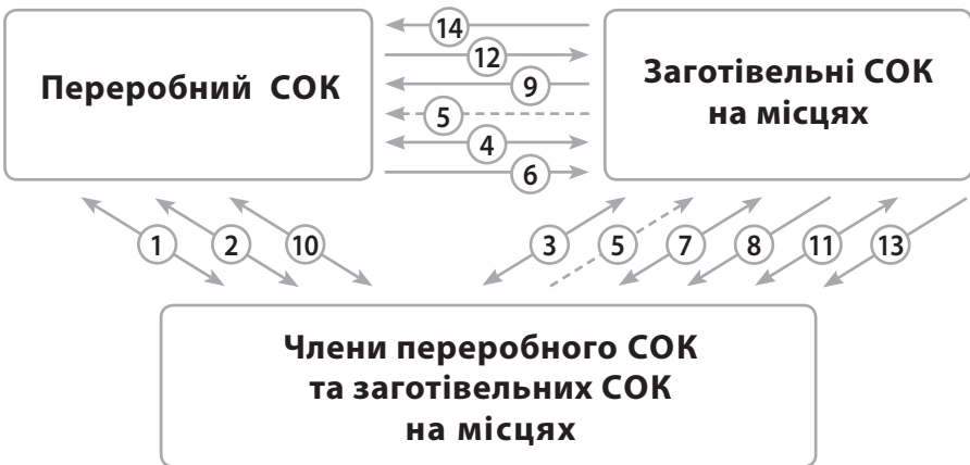
1.3. Схема взаємодії та розрахунків між переробним СОК, заготівельними СОК на місцях та фізичними особами, які є членами обох кооперативів.

Пояснення операцій до схеми 1.3 наводяться у порядку послідовності: