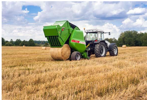
Виробник с/г машин СІПМА