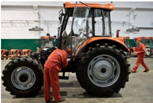
Тракторний завод Урсус